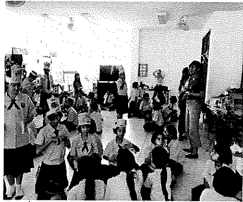
ภาพที่ 1.2 นักเรียนค้างทำนึ่งยุงลายระยะต่างๆที่มา ที่มา : ทิพวรรณ สดศรี