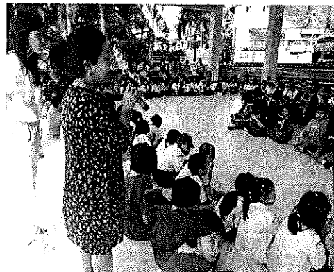
ภาพที่ 1.4 การจัดแสดงละคร

3.ผลที่เกิดขึ้นต่อนักเรียนชั้นประถมศึกษาปีที่ 4 และ 6 โรงเรียนเทศบาล 1 (บ้านเขาแก้ว) หลังจากเข้าร่วมกระบวนการละครสร้างสรรค์