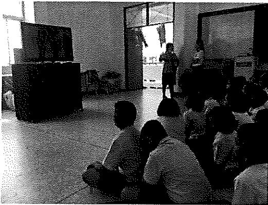
ภาพที่ 1.1 นักเรียนดูสื่อละครเกี่ยวกับไข้เลือดออก