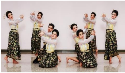
ภาพที่ 14 ลักษณะดอกตูมของดอกพะยอมที่รวมกันเป็นช่อใหญ่