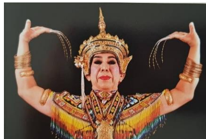
ภาพที่ 2 วงเขาควางย – ท่ารำโนรา