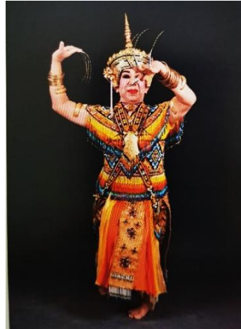
ภาพที่ 12 ท่ารำโนรา - ท่าสอดสร้อย