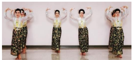
ภาพที่ 28 แกวรูปตัว N