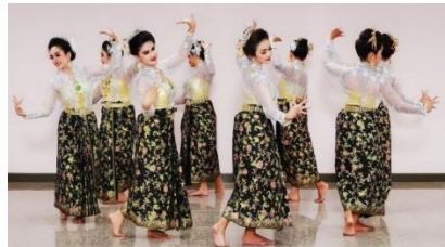
ภาพที่ 27 วงกลม