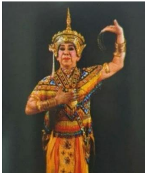
ภาพที่ 10 ท่ารำโนรา - ท่าเพียงอก