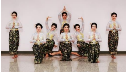
ภาพที่ 29 การจัดชุด