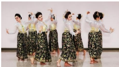
ภาพที่ 5 วงเขาควายเป็นลักษณะดอกบานของ ดอกพะยอม