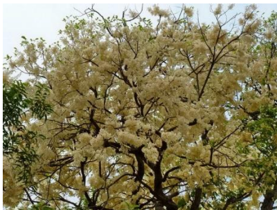
ภาพที่ 1 ดอกพะยอม ดอกไม้ประจำจังหวัดพัทลุง

- พะยอม เป็นไม้ยืนต้นขนาดกลางถึงขนาดใหญ่ เปลือกต้นหนาสีน้ำตาลหรือสีเทาเข้ม ดอก มีสีเหลืองอ่อนหรือสีขาวนวลมีกลิ่นหอมออกรวมกันเป็นช่อใหญ่ตามปลายกิ่งหรือเหนือรอยแผลใบใกล้ ๆ ปลายกิ่ง โคนขอบกลีบฐานรองดอกจะเกยกันแต่ไม่ติดเป็นเนื้อเดียวกัน มี 5 กลีบ กลีบดอกจะจีบเวียนกันไปตามเข็มนาฬิกา กลีบรองกลีบดอกเกลี้ยงสีคล้ำขอบหยักเป็นฟันเลื่อย