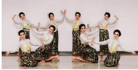
ภาพที่ 16 ลักษณะดอกตูม ดอกแย้ม และดอกบานของดอกพะยอมรวมกันเป็นช่อใหญ่

ช่วงที่ 1 กระบวนท่ารำที่สร้างสรรค์มาจากลักษณะของดอกพะยอม เช่น กลีบดอก เกสร ใบ กิ่ง การผลิบาน การเบ่งบาน การออกดอกสะพรั่ง ลักษณะของการออกดอกหลาย ๆ ดอกรวมกันเป็นช่อใหญ่ ระดับความสูง - ต่ำ ใช้การจับนิ้วกลางที่สร้างสรรค์ขึ้นใหม่ แทนลักษณะของดอกพะยอม