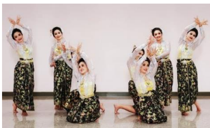
ภาพที่ 15 ลักษณะดอกแย้มของดอกพะยอมที่รวมกันเป็นช่อใหญ่