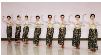
ภาพที่ 11 ท่าเพียงอก - ท่าเชื่อม