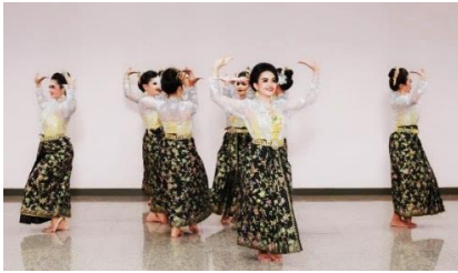
ภาพที่ 3 วงเขาควายเป็นลักษณะดอกบานของ ดอกพะยอม