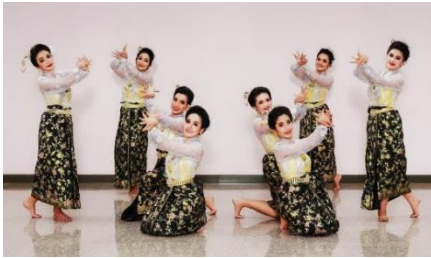
ภาพที่ 9 ท่าจีบไขว้ - ลักษณะดอกตูมของดอก พะยอม