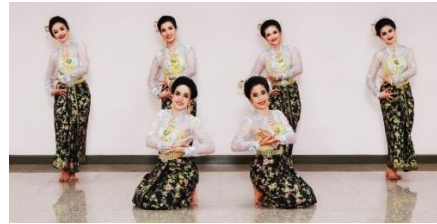
ภาพที่ 21 แถวหน้ากระดาน