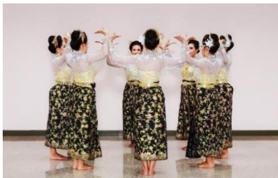
ภาพที่ 4 วงเขาควายเป็นลักษณะดอกบานของ ดอกพะยอม