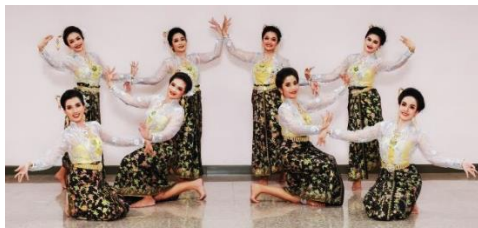
ภาพที่ 30 การจัดชุด