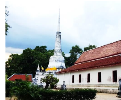
ภาพที่ 17 วัดเขียนบางแก้ว