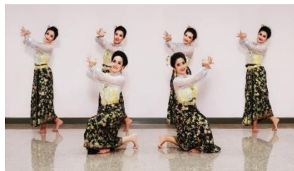
ภาพที่ 8 ทำจีบไขว้ - ลักษณะดอกตูมของดอก พะยอม ที่มา: กฤติยา ชูสงค์