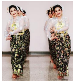
ภาพที่ 22 แถวตอน