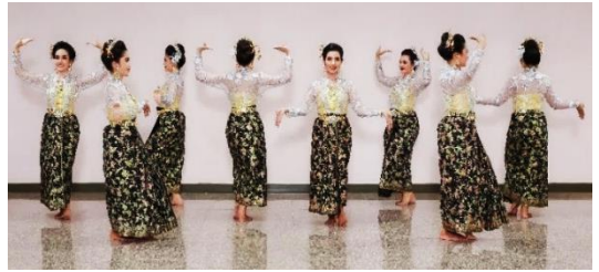
ภาพที่ 6 วงเขาควายเป็นลักษณะดอกบานของ ดอกพะยอม