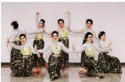
ภาพที่ 20 ทำรำเขากอกทะเล

ขั้นตอนที่ 3 การแปรแถว การ ออกแบบกระบวนการแปรแถวนำแนวคิดการใช้ พื้นที่เวทีในรูปแบบสมดุลง ใช้พื้นที่กลางเวทีเป็น