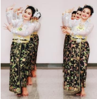
ภาพที่ 23 แกวตอน