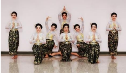
ภาพที่ 18 ทำรำวัดเขียนบางแก้ว