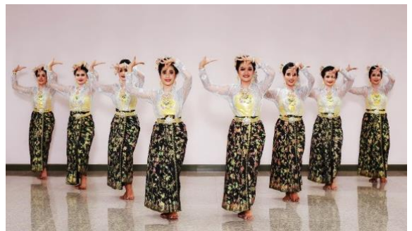
ภาพที่ 13 ท่าสอดสร้อย - ท่าเชื่อม

- กระบวนท่ารำ คณะผู้วิจัยได้ สร้างสรรค์กระบวนท่ารำระบำดอกพะยอมโดย ได้รับแรงบันดาลใจจากลักษณะของดอกพะยอม , สถานที่ท่องเที่ยวที่สำคัญของจังหวัดพัทลุง, ท่า