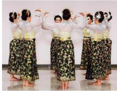
ภาพที่ 26 วงกลม