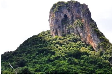
ภาพที่ 19 เขากอกทะเล สัญลักษณ์ประจำ จังหวัดพัทลุง