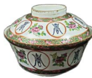
ภาพประกอบที่ 1 ชามเบญจรงค์พร้อมฝา