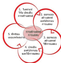
ภาพประกอบที่ 2 แผนภูมิดอกไม้ 5 กลีบ

ผู้ศึกษาได้สร้างสรรค์ชุดการแสดงระบำอวยพร ชุดว่าน โช่ว อู่ เจียง ในรูปแบบนาฏศิลป์ไทยร่วมสมัยโดยยึดแนวคิดการสร้างสรรค์ชุดการแสดงดอกไม้ 5 กลีบ ของจรรยาสมุทร ผลบุญ (2560) ในการสร้างสรรค์ และเขียนผลการวิจัยซึ่งแบ่งขั้นตอนการทำงานสร้างสรรค์ดังนี้