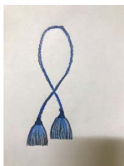
ภาพประกอบที่ 10 พู่ห้อยเงิน

2.3.1 พู่ห้อยเงิน ผู้ศึกษาได้สัมภาษณ์กลุ่มผู้รู้ ได้แนวคิดว่าพู่ห้อยเงินมาห้อยบริเวณเอวเพื่อเสริมความเป็นมงคลและสื่อความหมายอายุยืนยาว เป็นของตกแต่งโบราณ จะใช้สีน้ำเงินที่ได้จากขามเบญจรงค์พร้อมฝาจะถักเปียเส้นใหญ่ยาว 1.25 เมตร และทำพู่ 2 ข้าง ซ้ายขวาให้พู่เพื่อความสวยงาม ( สัมภาษณ์ , อลิษา ชูชำนาญ (การสื่อสารส่วนบุคคล,19 กุมภาพันธ์ 2563 )