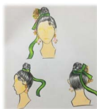
ภาพประกอบที่ 8 ทรงผม

2.2 ทรงผม เพื่อแสดงสัญลักษณ์ของชาวจีนในการสร้างสรรค์งาน ผู้ศึกษาใช้การถักเปีย ม้วนเปียให้ เป็นมวยผมกลางศีรษะ ด้านหน้าจะทำทรงน้ำไหล ปักปิ่นและผูกโบว์รอบๆมวยผม