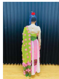
ภาพประกอบที่ 11 ชุดแต่งกาย ระบำอวยพรชุด วาน โช่ว อุ๋ เจียง