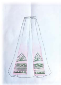
ภาพประกอบที่ 7 กระโปรง

2.1.4 กระโปรง ผู้ศึกษาเลือกใช้ผ้าสีขาวยและมีห้อยข้างยาวรอบกระโปรงลงมาถึงชายกระโปรงปัก ลายพุ่มข้าวบิณฑ์บริเวณเชิงห้อยข้างทั้งสองข้างโดยใช้เทคนิคการปักชุดละครไทย