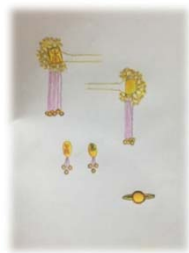
ภาพประกอบที่ 9 เครื่องประดับ